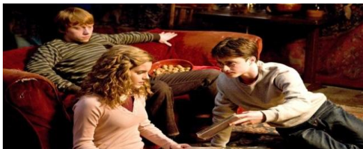
Imagen de la película ' Harry Potter ', basada en la saga de libros de fantasía.