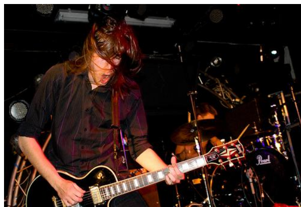
Imagen del concierto de la banda de rock independiente You me at six.