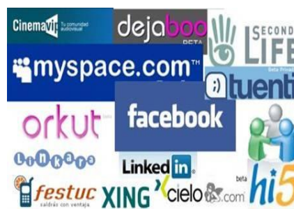
Algunas redes sociales.