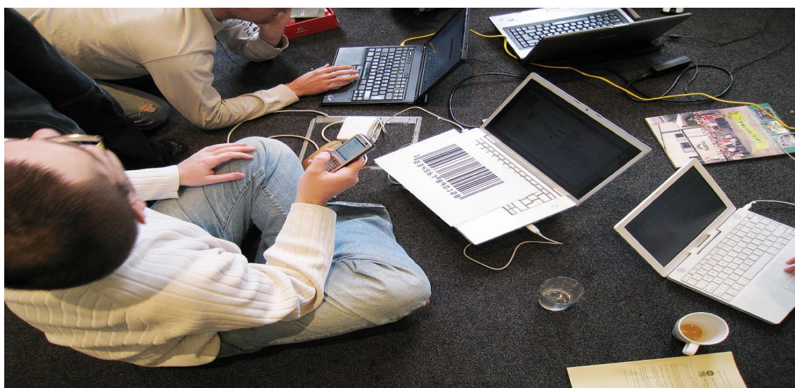
Tecnología por todas partes.

Una nueva generación de jóvenes con pensamientos completamente distintos vinculados a Internet y lo alternativo es ya una realidad. Ellos mismos cuentan las motivaciones y experiencias que están formando su personalidad y raciocinio.